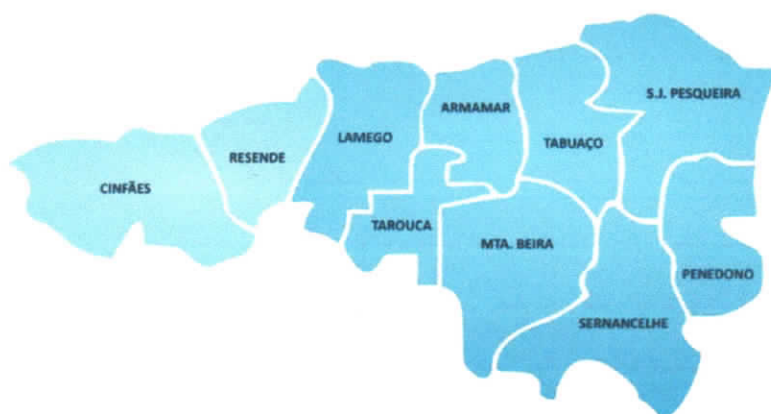
Mapa 1 – Concelhos com intervenção da Aldeias Humanitar

A intervenção Humanitar de Cuidados Complementares Integrados é realizada nos dez concelhos do Douro Sul, nomeadamente, Semancelhe, Penedono, Tabuaço, Moimenta da Beira, Armamar, Tarouca, Lamego, São João da Pesqueira, Cinfães e Resende (mapa 1).